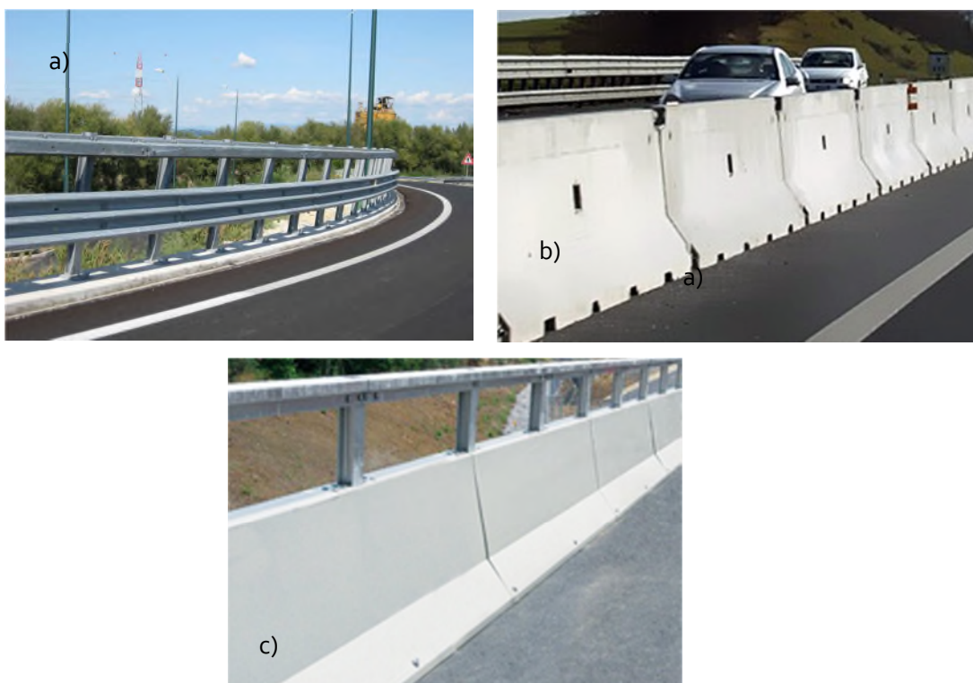
Figura 1 – Tipologie barriere di sicurezza: a) Guard Rail; b) New Jersey in c.a.; c) New Jersey in acciaio