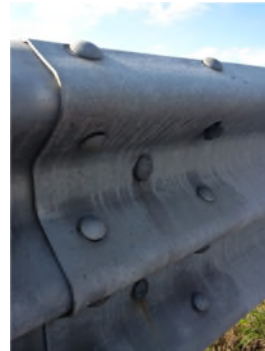
Figura 3 – Esempi di non integrità dei dispositivi di sicurezza

Con riferimento ai supporti (cordoli in c.a. per le barriere bordo ponte o il terreno per le barriere infisse), si evidenzia come la perdita di efficienza del supporto possa essere riscontrata sia direttamente che indirettamente (ad esempio, l'assenza di verticalità o la riduzione di quota delle barriere infisse può essere dovuta alla presenza di cedimenti delle banchine o dei terreni poco compattati). Dovranno quindi essere valutate, tra le altre, le seguenti possibili anomalie: