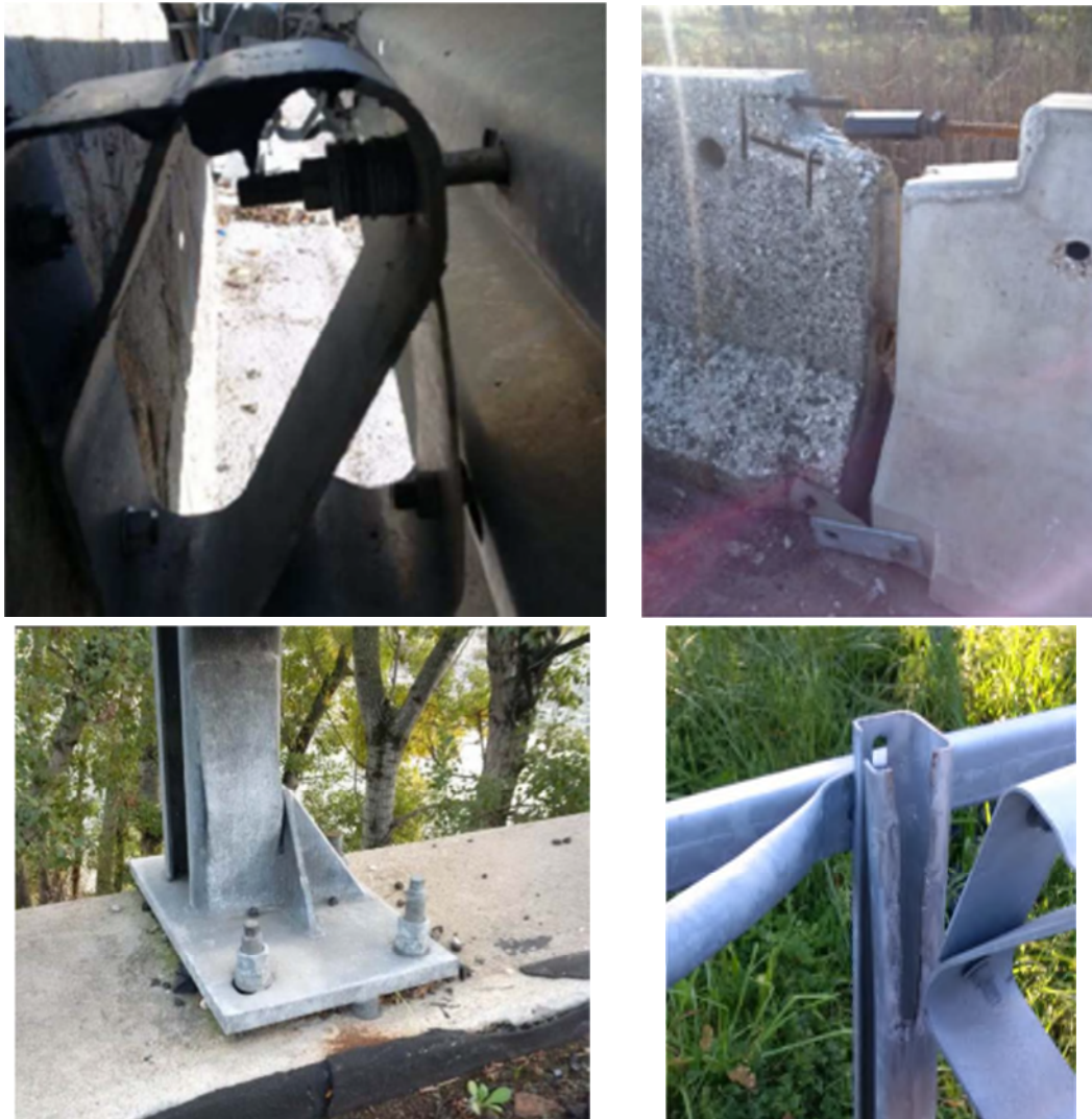
Figura 2 – Esempi di non conformità dei dispositivi di sicurezza

Occorre verificare lo stato di conservazione (o di degrado) dei dispositivi, valutando la presenza delle seguenti possibili anomalie (Figura 3):